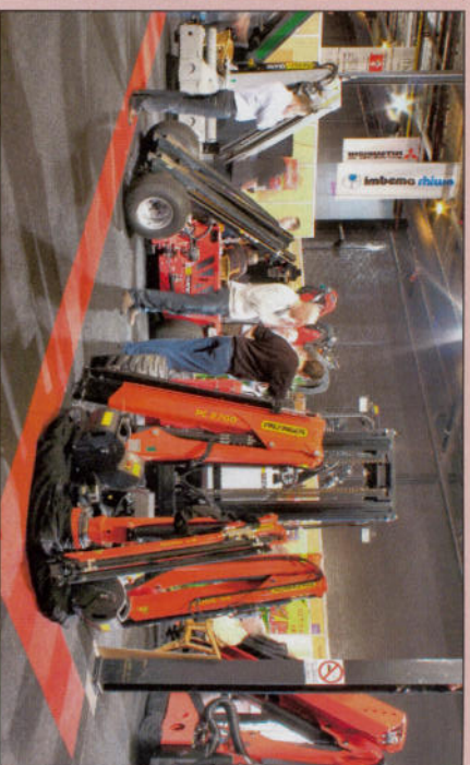
...en Palfinger Nederland waren weer goed vertegenwoordigd.