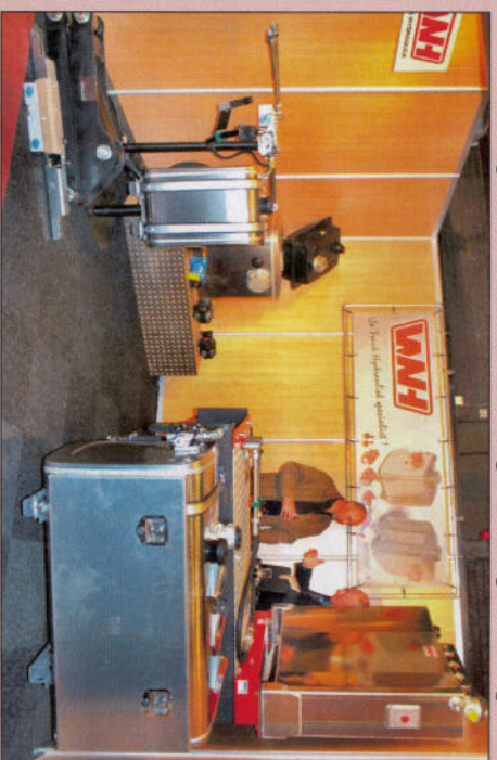
WNH heeft een aantal nieuwe RVS hydrauliek tanks in het leeningsprogramma, waaronder een zeer platte (geheel rechts boven).