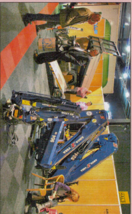
Amco Veba-importeur TTN Ederveen...