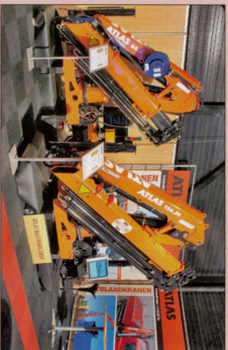
Atlas wordt nu door de fabrikant zelf op de Noord-Nederlandse markt gebracht.