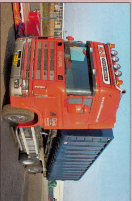
All-In containers met een eigen Scania voor het afleveren van de containerbakken.