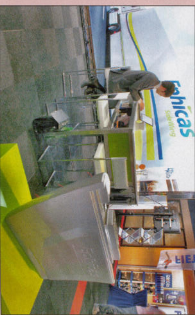
Op de voorgrond rechts ziet men goed de speciale vleugel-vorm van de Ephicas SideWing.