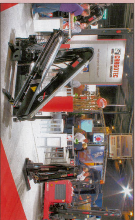
Kranenimporteurs, waaronder Cargotec....